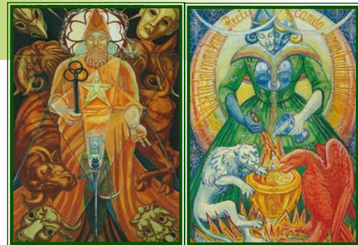
Karten: (Crowley/Harris-Tarot) Copyright © Ordo Templi Orientis / AGM