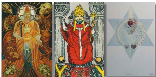
Trumpf V - Copyright v.l.: Crowley/Harris-Tarot, © Ordo Templi Orientis Smith/Waite-Tarot, © Königsfurt Urania Verlag 1975-Tarot von © Johannes Dörflinger

Das Alt-Bewährte will immer wieder vom Neuen befruchtet werden, um überdauern zu können. Damit das gelingt, braucht dieses „Sternkind“ natürlich Unterweisung für einen guten Start ins Leben. Genauso wichtig ist es für uns von ihm zu lernen. Dabei helfen Offenheit und Neugierde für die Weisheit der Unschuld sowie das unberechenbar Neue - sonst erstarrt / stirbt die altherwürdige Weisheit und wird zu totem Wissen - die Tradition erstarrt zu leeren Ritualhülsen.