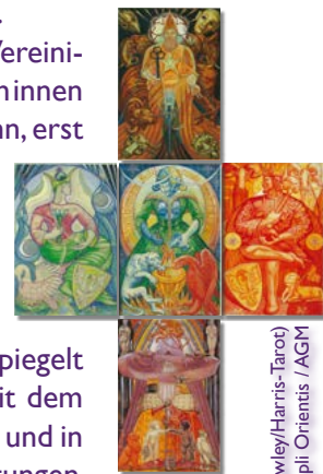
Karten: (Crowley/Harris-Tarot) Copyright © Ordo Templi Orientis / AGM

Auch wenn sich gemeinhin die Vereinigung der Pole öfter von aussen nach innen entwickelt., macht es genauso Sinn, erst in sich selbst „ganz“ und „heil“ zu werden, es gut mit sich selbst auszuhalten und im Alleinsein Erfüllung zu finden, um infolgedessen diese Ganzheit auch im Aussen gespiegelt zu erleben. In der Begegnung mit dem „Du“ werden wir so viel seltener und in kürzeren Episoden in alte Erwartungen, Abgängigkeitsmuster, Kontrolldramen und Verstrickungen verfallen. Wie innen so aussen: Wenn die Innere Hochzeit gelingt, können wir uns auf schöne freie, erwachsene Begegnungen im Aussen freuen. ☺