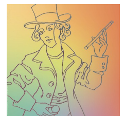
Key Visual © Nil Orange Der Magier | Orange Luna Tarot

Es wird wieder hochkarätige Vorträge und Workshops geben. Daneben ist ausreichend Raum für Austausch und Vernetzung sowie dem Stöbern in der Tarot-Auslage eingeplant.