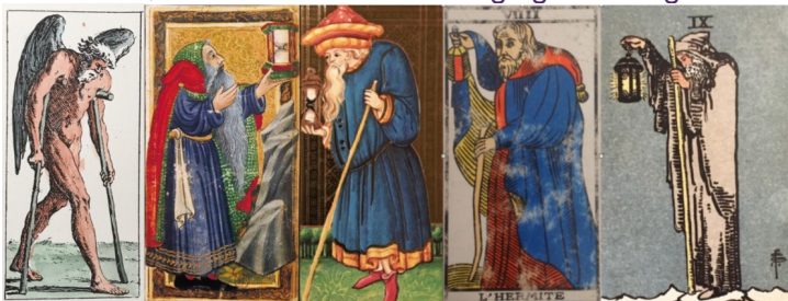
v.l.n.r.: Trumpf VIII / IX im Tarocchino Bologna 1660 © Il Meneghelli edizioni, Charles VI (or Gringonneur) Deck; Le tarot dit de Charles VI (Wikimedia commons), Visconti Sforza Tarot, © Lo Scarabeo, Tarot de Marseille und Borderless Smith/Waite-Tarot © US Games Systems

In historischen Tarots wird der alte Mann noch gebrechlich oder bucklig dargestellt oder er trägt ein Stundenglas statt der Laterne, was den Fokus auf die Vergänglichkeit legt.