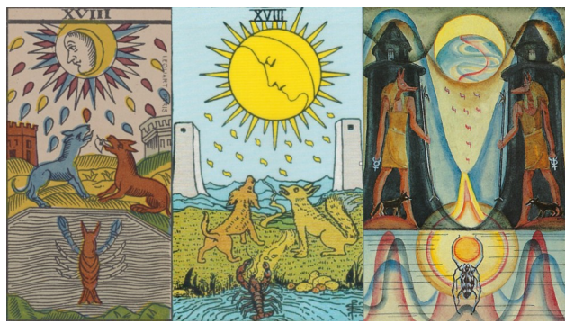
v.l.n.r.: Trumpf XVIII im Tarot de Marseille (Wikimedia commons), Smith/Waite-Tarot © Königsfurt Urania Verlag und Crowley/Harris-Thot-Tarot © Königsfurt Urania Verlag (O.T.O.)

Er wird sich in seiner Meinungsbildung nicht von Werbung und Propaganda abhängig machen und auch nicht aus Angst vor Einsamkeit der Masse hinterherlaufen. Selbst mit Menschen, die ich liebe oder achte (Familie, Freunde, Peergroup, Kollegen), muss ich nicht immer einer Meinung sein! In der Folge können wir uns selbst und anderen mehr Individualität zugestehen. Parallel zur fortschreitenden Individuation des Einzelnen ist in der Gesellschaft eine Entwicklung hin zu wachsenden Individualisierung und Diversität zu erkennen. Starke Veränderungen machen jedoch immer auch Angst. Und bevor sich eine neue Ordnung einstellen kann, werden die alten Kräfte sich erheben und versuchen ins Gewohnte „zurückzukrebsen“, um die alte Ordnung wiederherzustellen – ggf. auch gewaltsam.