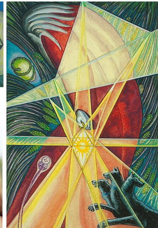
Karten: © Königsfurt Urania / O.T.O.