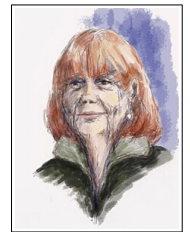
Portrait von Gisèle Pelicot

Der Prozess Pelicot in Frankreich über die Vergewaltigungen von Mazan ist ein herausragendes Beispiel, wie die anspruchsvolle Energie der Karten auf höchstem Niveau gelebt und transformatorisch genutzt wurde. Die persönliche Entscheidung einer einzigen Person hat dabei alles verändert und auch auf über-persönlichen Ebenen für das Kollektiv enorm viel in Bewegung und Ausgleich gebracht.