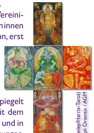
Karten: (Crowley/Harris-Tarot) Copyright © Ordo Templi Orientis / AGM

Und wie kann man das alles nun praktisch für sich nutzen? Dafür hat es abschliessend noch ein paar Anregungen.