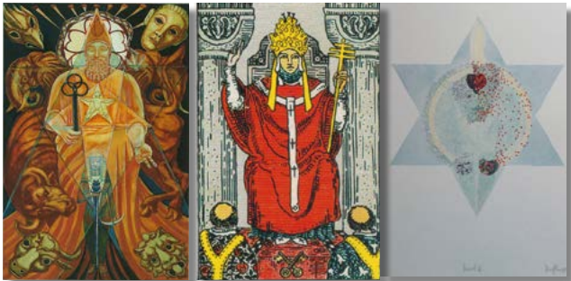
Trumpf V - Copyright v.l.: Crowley/Harris-Tarot, © Ordo Templi Orientis Smith/Waite-Tarot, © Königsfurt Urania Verlag 1975-Tarot von © Johannes Dörflinger

Das Alt-Bewährte will immer wieder vom Neuen befruchtet werden, um überdauern zu können. Damit das gelingt, braucht dieses „Sternkind“ natürlich Unterweisung für einen guten Start ins Leben. Genauso wichtig ist es für uns von ihm zu lernen. Dabei helfen Offenheit und Neugierde für die Weisheit der Unschuld sowie das unberechenbar Neue - sonst erstarrt / stirbt die altherwürdige Weisheit und wird zu totem Wissen - die Tradition erstarrt zu leeren Ritualhülsen.