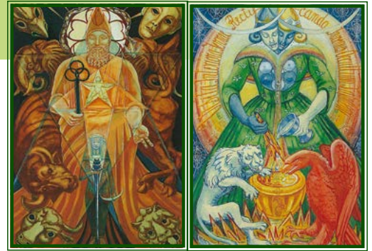
Karten: (Crowley/Harris-Tarot) Copyright © Ordo Templi Orientis / AGM